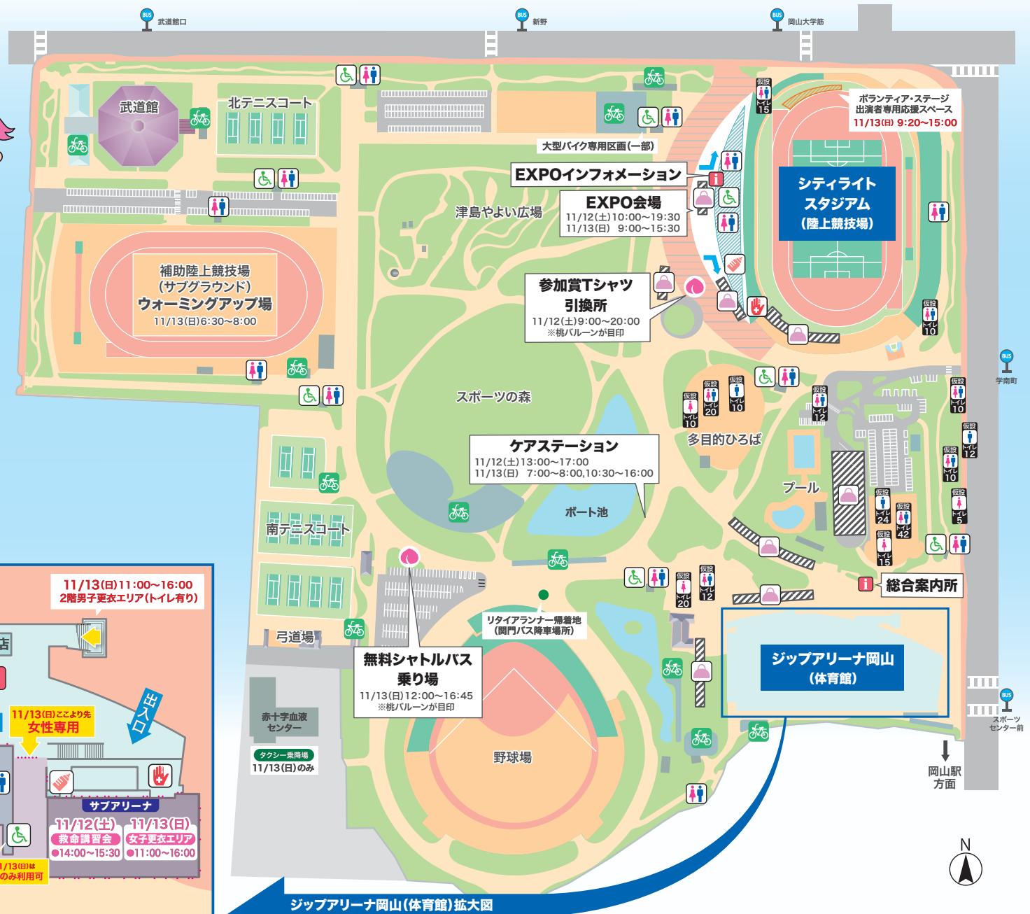
ジップアリーナ岡山(体育館)拡大図