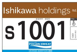
アスリートビブス