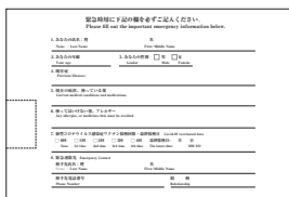
アスリートビブス裏面

注 アスリートビブスの裏面にある緊急時用の必要事項を大会当日までに必ず記載ください。